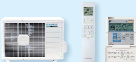
RXG 25 J